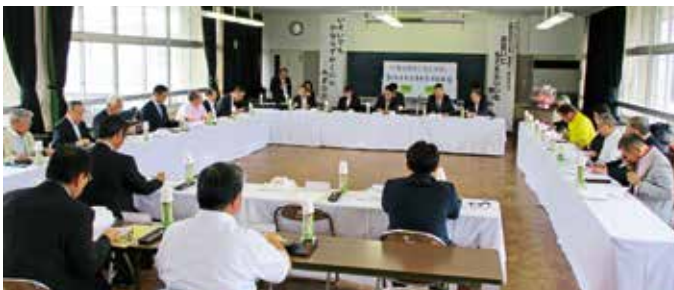
設立総会の状況 (於長崎交通公園会議室)

10月1日の設立総会には、県や県警本部等の交通関係者を来賓に招き、役員、地区代表の正会員が集まり設立総会を開催しました。