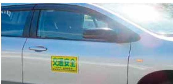
(交通安全を呼びかける当協議会の車両)

が実施され、当協議会・地区協議会及び加入事業所も参加し交通安全運動を展開しました。