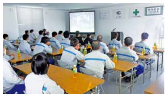
10/17 九電工関連会社での教養風景