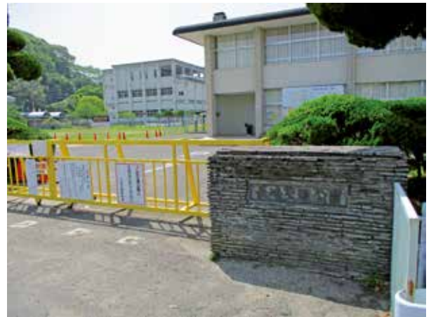
(長崎交通公園の全景)